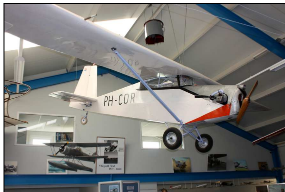
De PH-COR die illegaal een vluchtje maakte vanaf het strand van Wijk aan Zee.