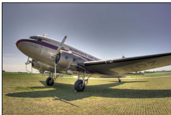
Dakota PH-DDZ (Foto: Tjalle den Ouden).