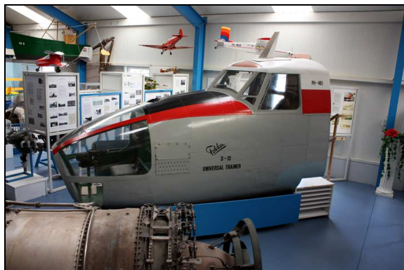
De cockpit sectie van de Fokker S-13.

Voor rondleidingen kunt u contact opnemen met het museum: 0222-311689 of info@lomt.nl .