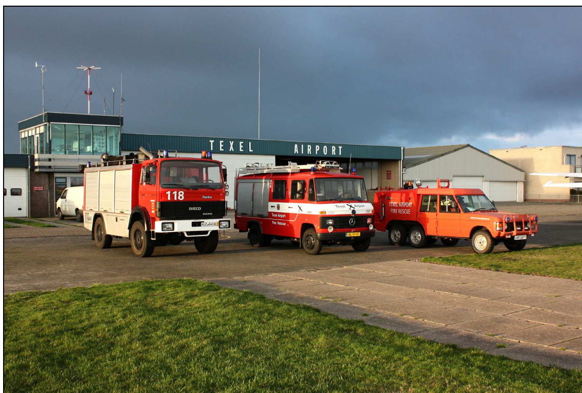
Van links naar rechts: Nieuwe IVECO (2.000 ltr), Mercedes (1.000 ltr) en de inmiddels verkochte Range Rover.

Overigens is Texel Airport standaard RFF3 met het huidige materieel en manschappen. Dit betekent dat toestellen met een lengte van 12 tot 18 meter zonder problemen op Texel terecht kunnen. Tot deze categorie behoren o.a.: Cessna 208B, Beech King Air 200 en 300, Dornier 228, Pilatus PC-12 en de diverse Citations.