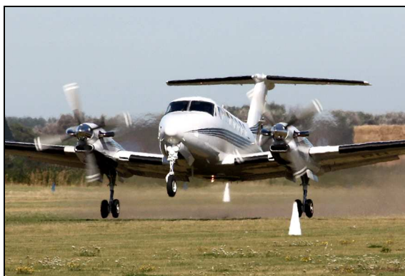
King Air 300, PH-ACE.