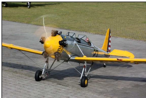
G-AGYY, oudste taildragger.