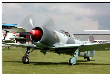
Nr. 2 was de YAK-3.