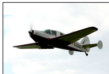
Langste afstand: N7600E.

De volgende Texel Taildragger & Old Timer Fly-in staat gepland in mei 2011.