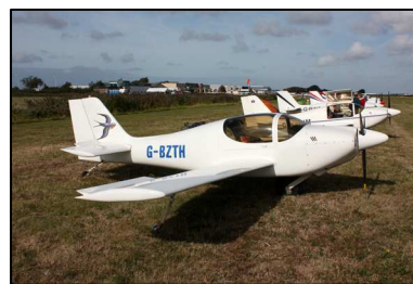
Bezoekers van de fly-in: G-RVIO (RV-10), PH-UGO (Pulsar) en G-BZTH (Europa).

De volgende Dutch Light Aircraft Fly-in staat gepland van vrijdag 17 tot en met 19 september 2010!