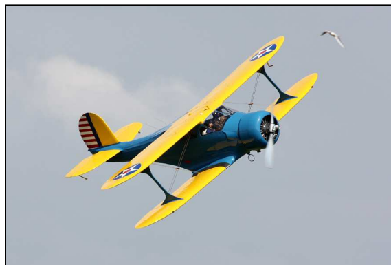
N295BS, de mooiste van de fly-in.